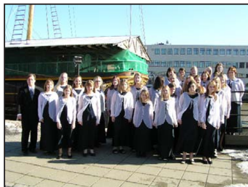
Tyttökuoro Tähdet kertovat.